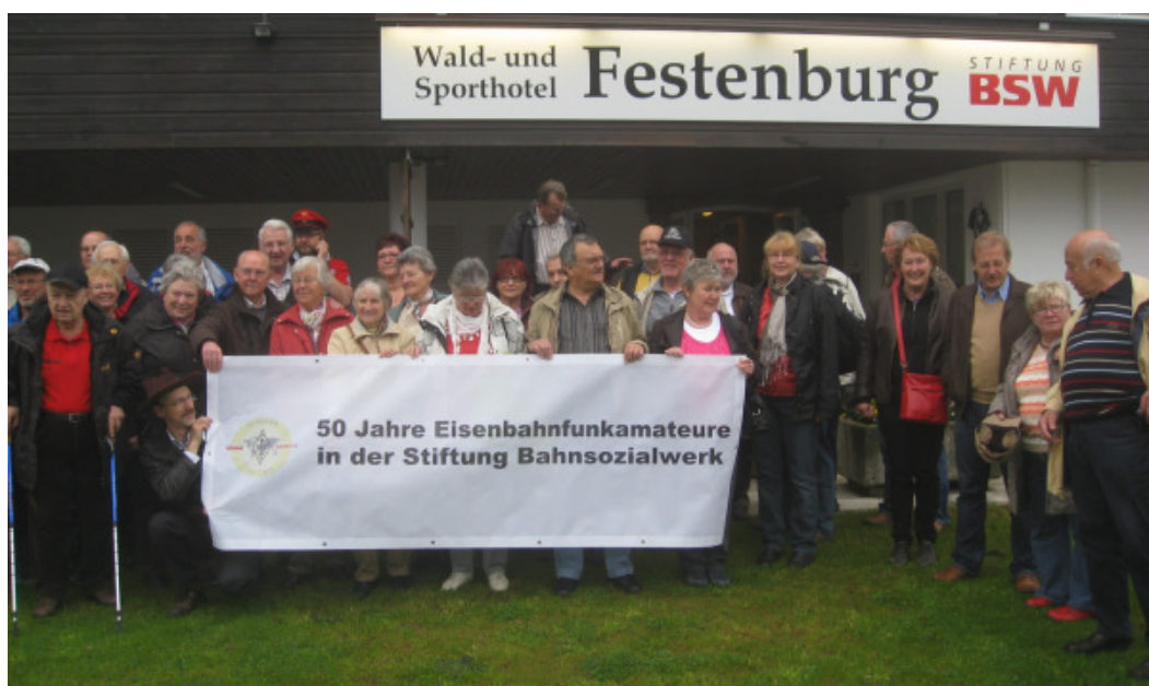
Teilnehmer des Deutschlandtreffens 2012 in Festenburg

STIFTUNG BSW Zusammengestellt von Detlef Gard, DK9VB