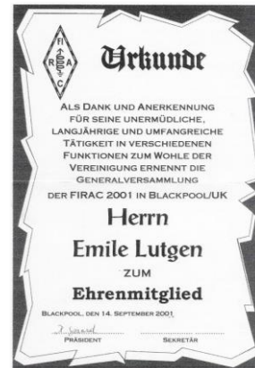
Abbildung des FIRAC-AWARD vom 15. Dezember 2003 und die Urkunde zum Ehrenmitglied der FIRAC vom 14. September 2001.